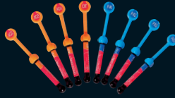
GRADIA® DIRECT Family