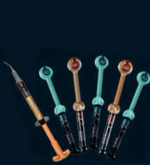
G-aenial™ Family G-aenial Universal Injectable

... die erfolgreichen Restaurations- und Befestigungssysteme von GC!