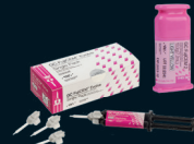
FujiCEM™ 2 SL FujiCEM Evolve